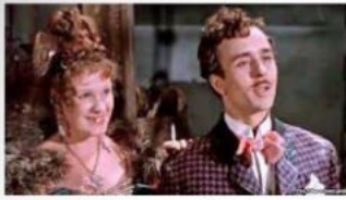
За двома зайцями