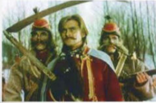
Тіні забутих предків